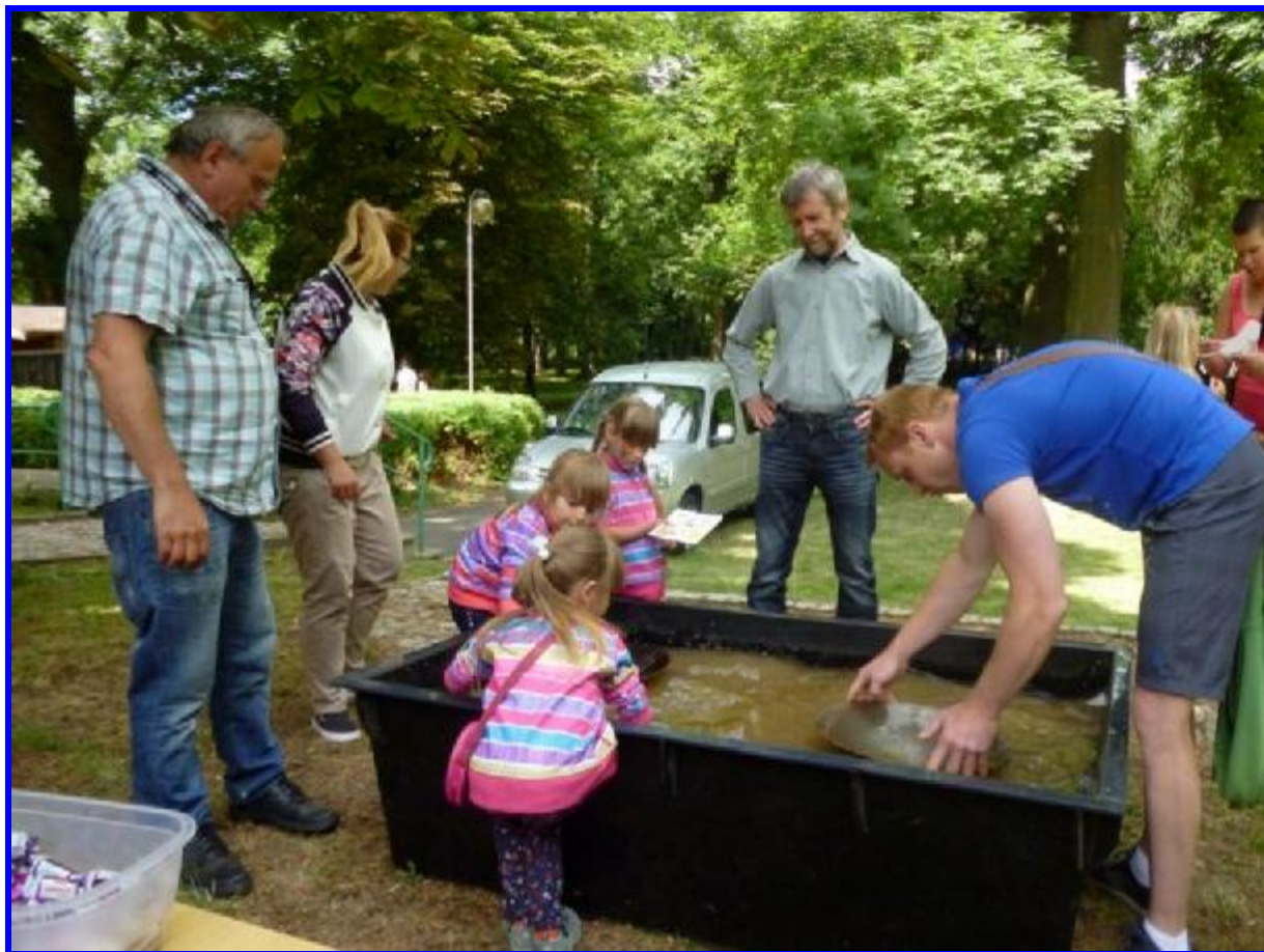
Trojčátka v akci.