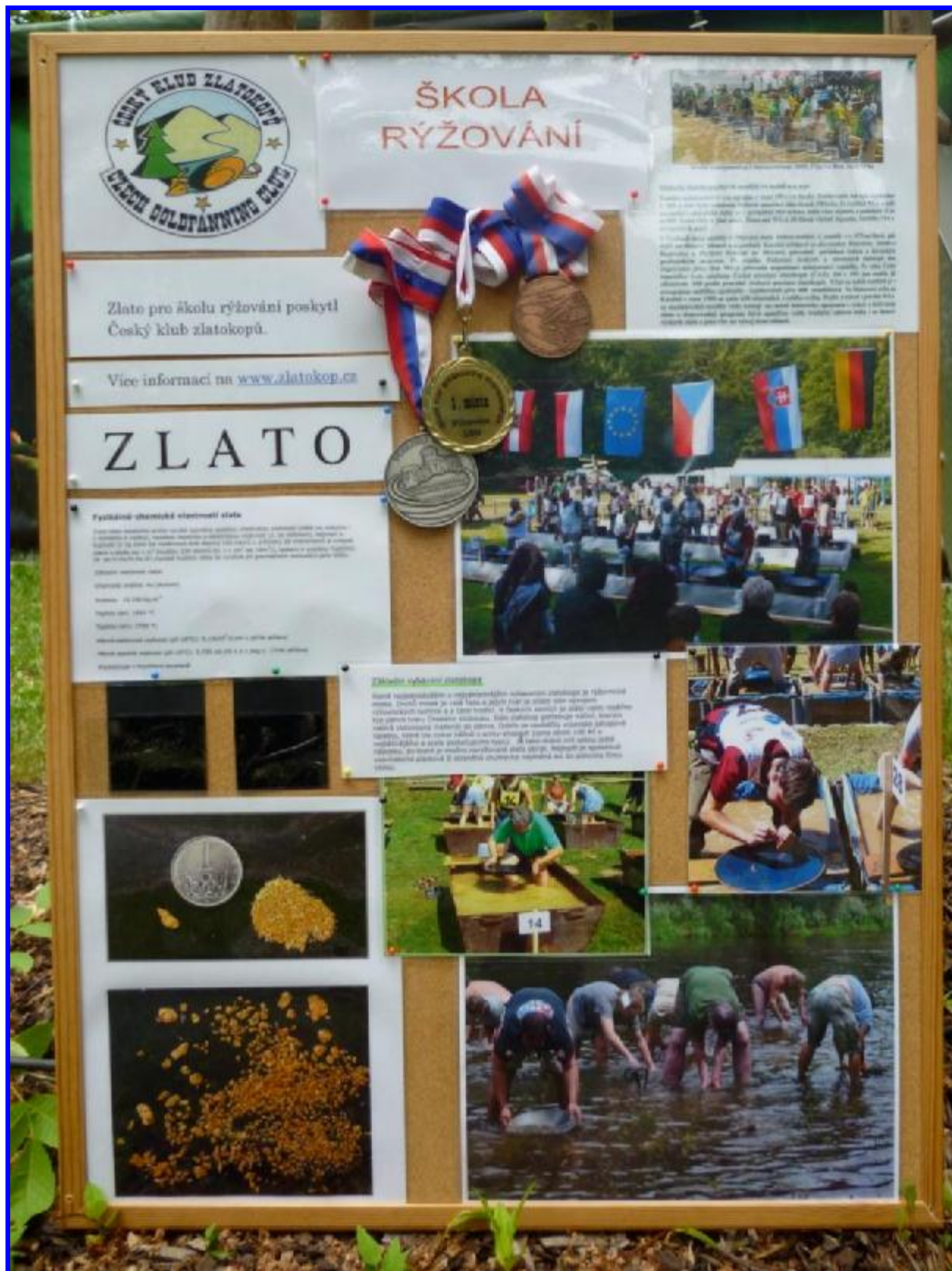
Pro návštěvníky školičky jsme si připravili malou informační nástěnku.