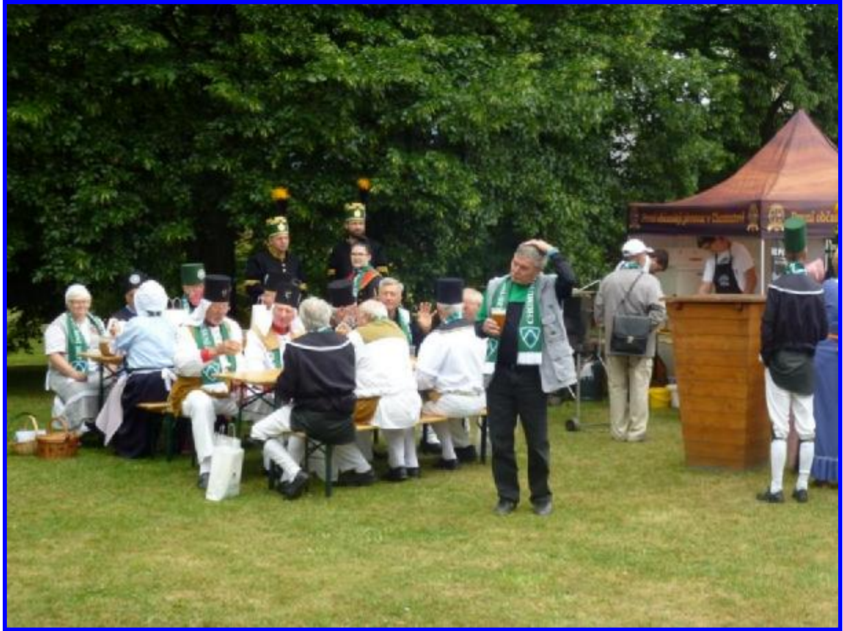
Ještě před průvodem se horníci museli občerstvit, pivo teklo proudem J