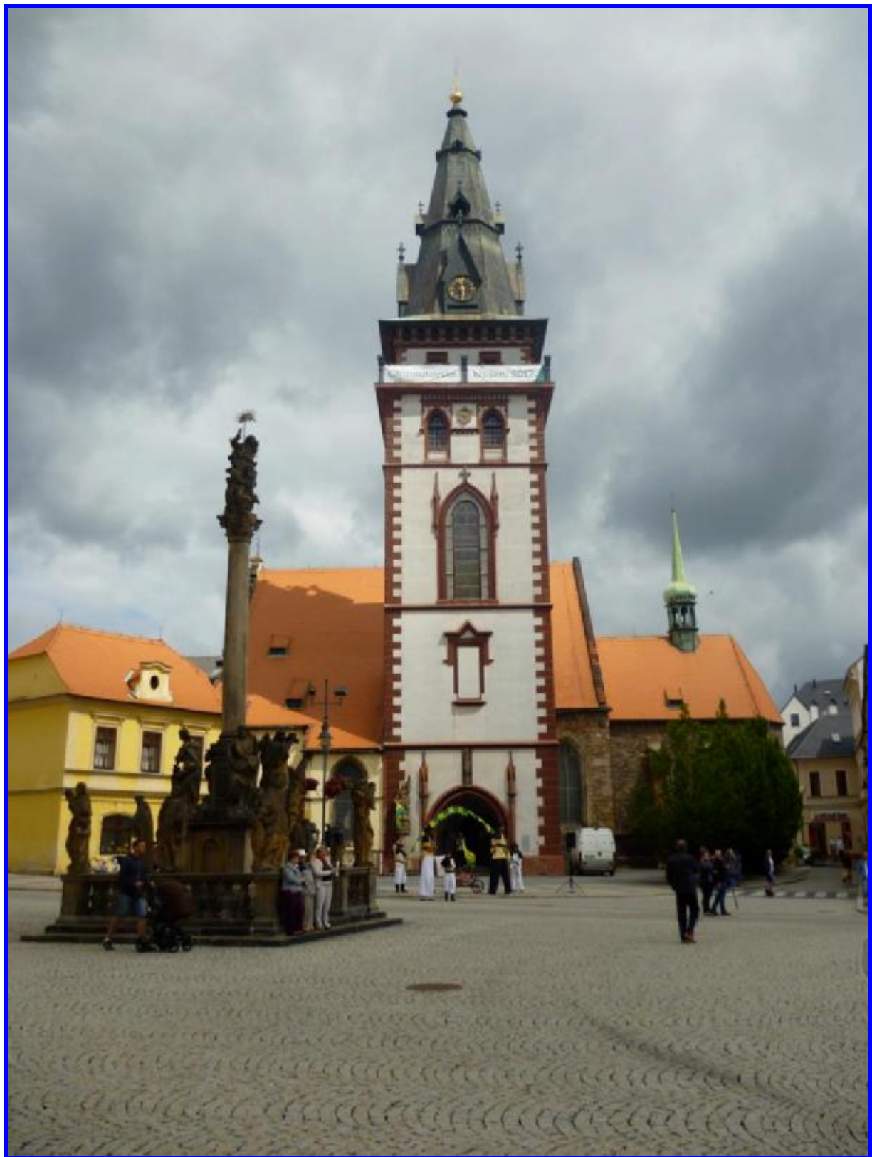
Městská věž – nejedna dominanta náměstí. Slouží jako vyhlídková věž, rozhledna. Nahoru vede 130 schodů. Ještě teď mě bolí nohy J